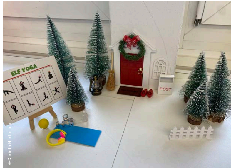
Willkommen in der Wichtelwelt: Dieser kleine temporäre Mitbewohner spielt nicht nur Streiche, er animiert die Kinder auch zum Yoga.

Schuleinheiten Wildenstein & Klostersgriet