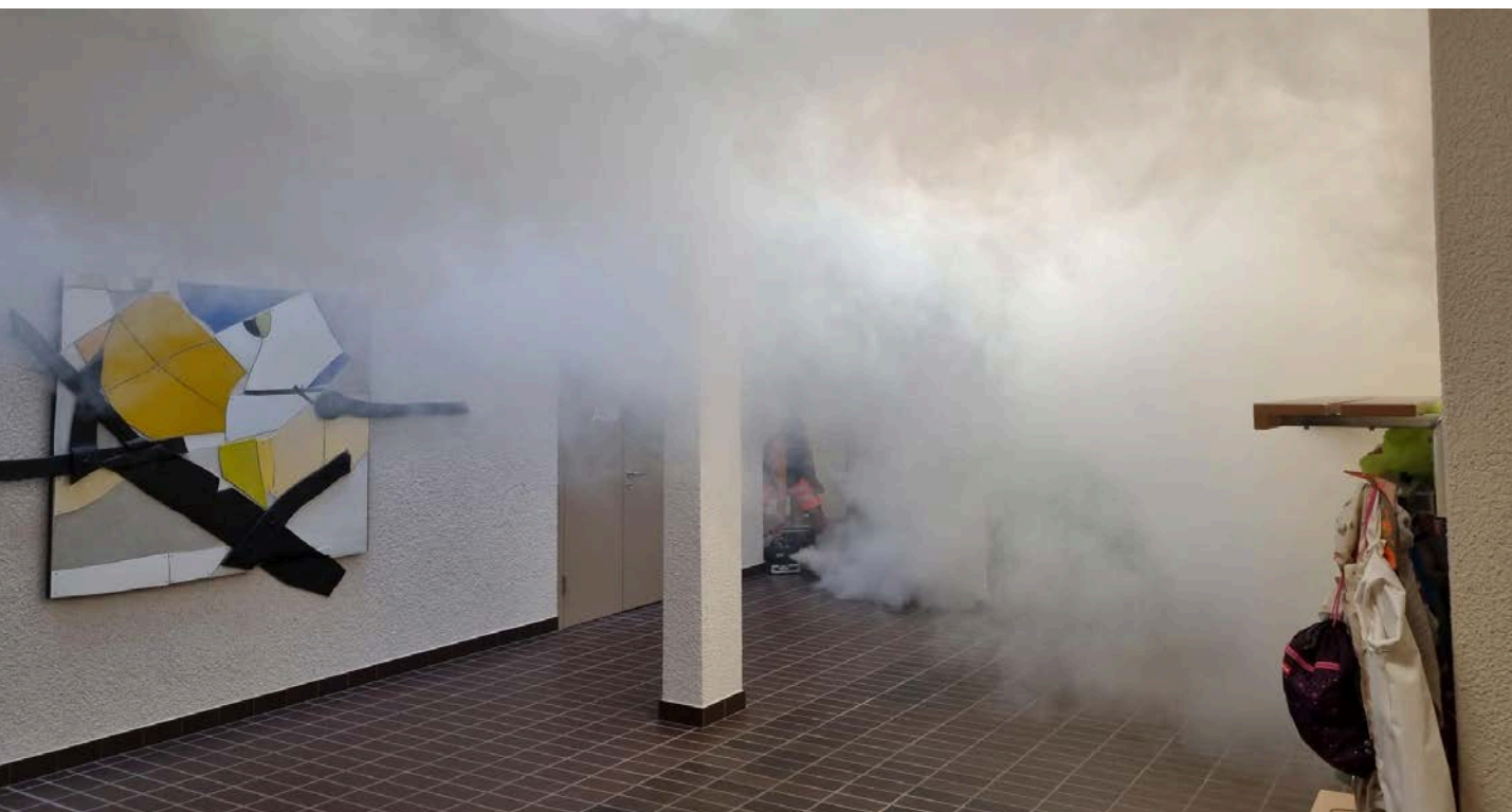
Notfallübung im Schulhaus Klosterguet