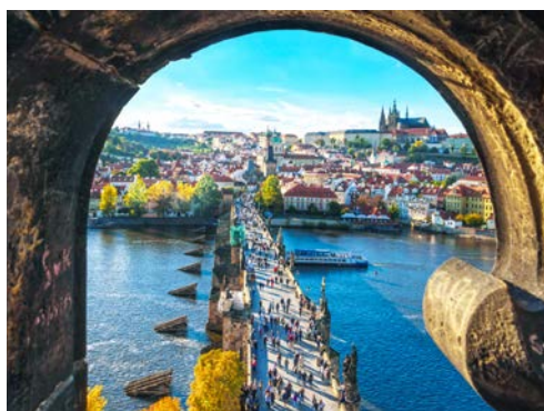
Komm mit nach Prag und erlebe einen tollen Städtetrip in Gemeinschaft