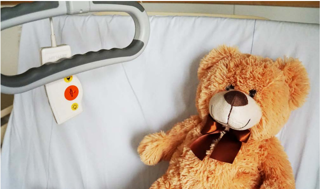
Teddy im Spital