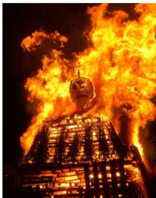
Warten auf den erlösenden Knall

19.00 Uhr Oberhalb Werkhof wird der Funken mit Bögg entzündet. Kinder mit Laternen sind herzlich willkommen.