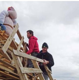
Teamegeist beim Funkenaufbau